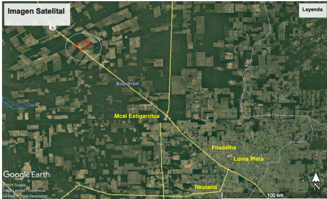
Imagen satelital Actualizada 2022